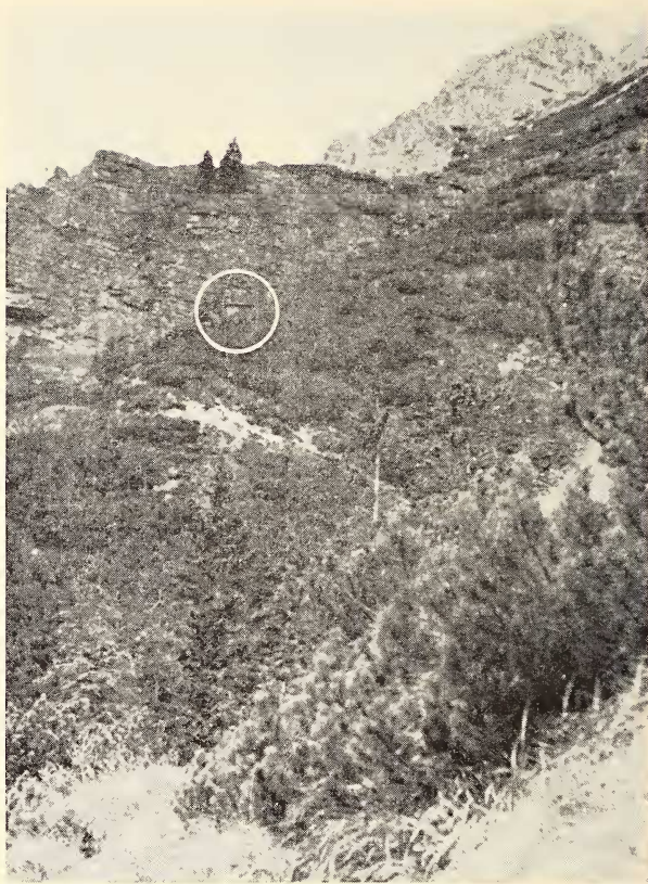
Abb. 4: Tagesversteck von Eptesicus nilssoni in der Knieföhrenzone, 1450 m ü. d. M. Im weißen Kreis die Hütte, wo das Exemplar Nr. 62 554 gefunden wurde.

Unser Material ist zwar nicht sehr reich, zeigt jedoch in groben Zügen ein Schwanken des Körpergewichts im Laufe des Jahres, das bei dieser Art nicht bekannt ist. Wie Tabelle 1 zeigt, ist der Unterschied zwischen dem Mindestgewicht im Februar von 6,5 g und dem Höchstgewicht im August von 17,5 g außerordentlich groß (beide Werte betreffen erwachsene Weibchen). Dabei halten unsere Beobachtungen nicht einmal extrem ungünstige Perioden fest, wie sie für die Tatrpopulation der Nordischen Fledermaus wahrscheinlich im April und Anfang Mai gegeben sind. Man kann daher annehmen, daß das Körpergewicht einzelner Exemplare innerhalb noch größeren Grenzen schwankt und sich vom Frühjahr bis zum Herbst fast verdreifacht, um dann im Laufe des Winters wieder zu sinken. So bedeutende Schwankungen des Körpergewichts sind bei keiner der anderen europäischen Fledermausarten bekannt, bei denen es während der Sommerperiode maximal zu einer Verdoppelung des Körpergewichts kommt. So stellte Gaisler (nicht publiziert) bei einer großen Serie von 1816 Exemplaren